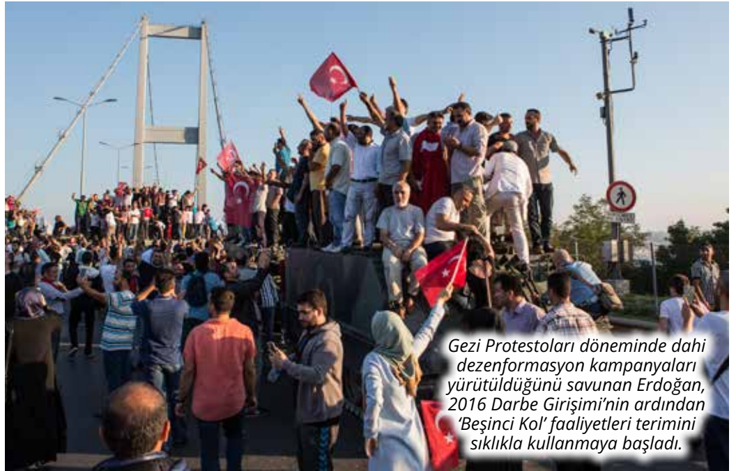
Gezi Protestoları döneminde dahi dezenformasyon kampanyaları yürütüldüğünü savunan Erdoğan, 2016 Darbe Girişimi'nin ardından 'Beşinci Kol' faaliyetleri terimini sıklıkla kullanmaya başladı.