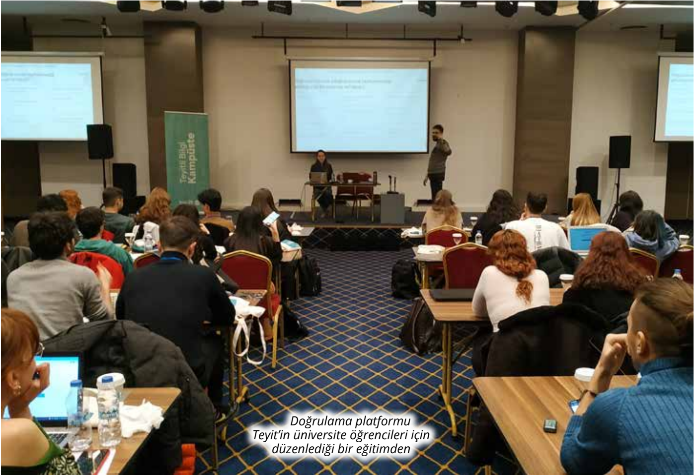
Doğrulama platformu Teyit'in üniversite öğrencileri için düzenlediği bir eğitimden