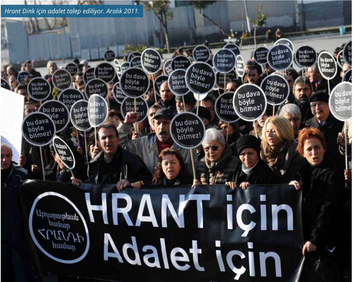
Hrant Dink için adalet talep ediliyor. Aralık 2011.

2009 yılında mahkeme, Bozkuş'u 14 yıl hapse mahkum etti. Balca, Kaya ve Tutar'ın da dahil olduğu 16 sanık ise müebbet hapis cezası aldı. Fakat henüz dosya karara bağlanmadan, 1 Ocak 2011'de yürürlüğe giren Ceza Muhakemeleri Kanunu (CMK), tutukluluk süreleri 10 yılı geçen 12 sanığın 3 Ocak'ta tahliye olmasına