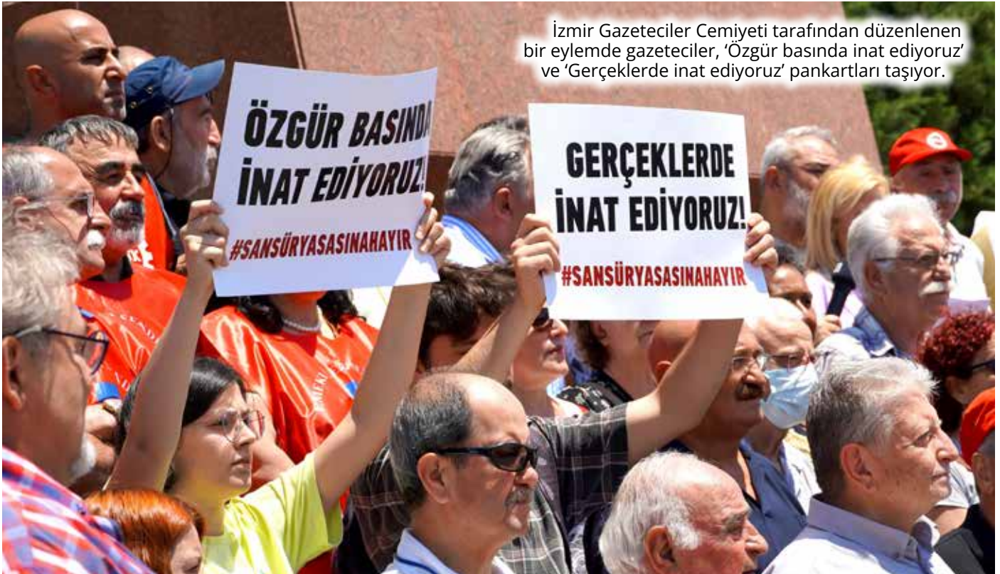
İzmir Gazeteciler Cemiyeti tarafından düzenlenen bir eylemde gazeteciler, 'Özgür basında inat ediyoruz' ve 'Gerçeklerde inat ediyoruz' pankartları taşıyor.

İşte bu özel medya kuruluşları “ele geçildikten sonra”, orada çalışan nitelikli ve bağımsız gazetecilere de – deyim