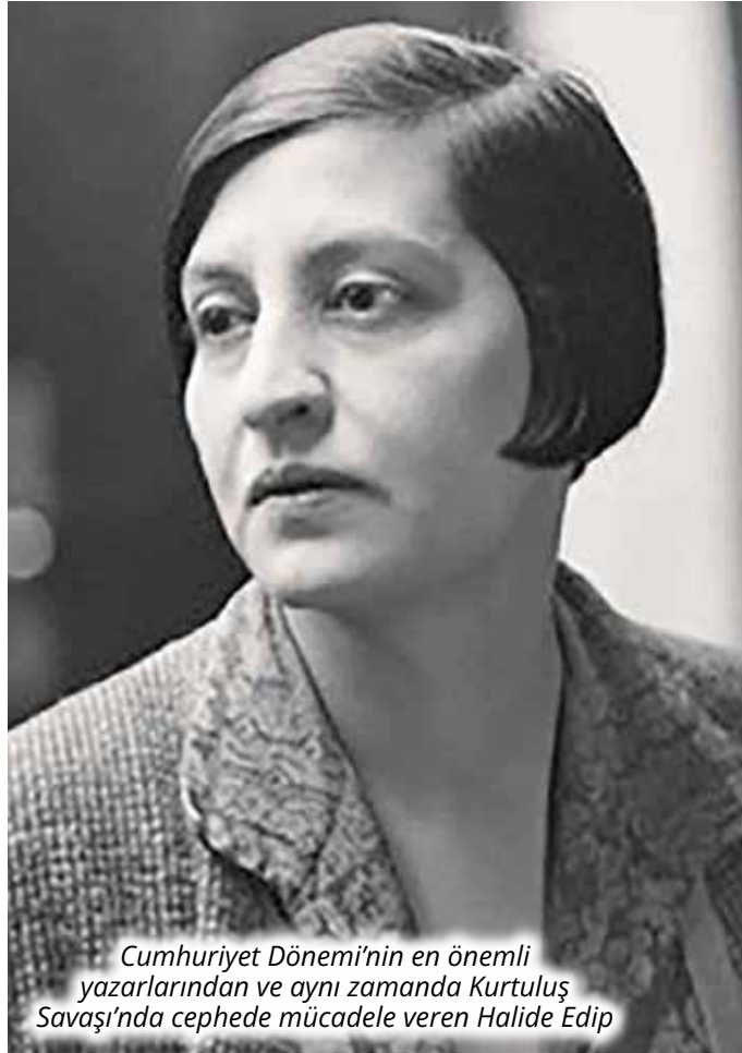
Cumhuriyet Dönemi'nin en önemli yazarlarından ve aynı zamanda Kurtuluş Savaşı'nda cepheye mücadele veren Halide Edip

Diğer yandan, 1980'li yıllarda kadın haklarının gelişiminin etkisiyle kadın gazetecilerin büyük bir bölümü, kadın konularını ağırlıklı olarak kadın sayfası ya da eklelerinde ele almaya başladılar. Bu dönemle birlikte gazetecilik, kadın için de bir meslek haline geldi.