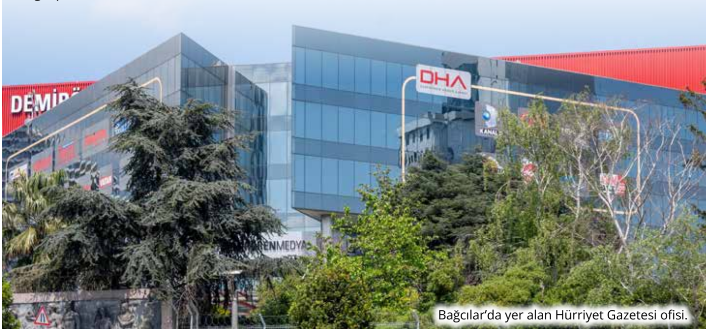
Bağcılar'da yer alan Hürriyet Gazetesi ofisi.

"Milli" meselelerde hassasiyetler söylemiyle editöryel bağımsızlığa müdahale, artık barizdir: 28 Aralık 2011'de