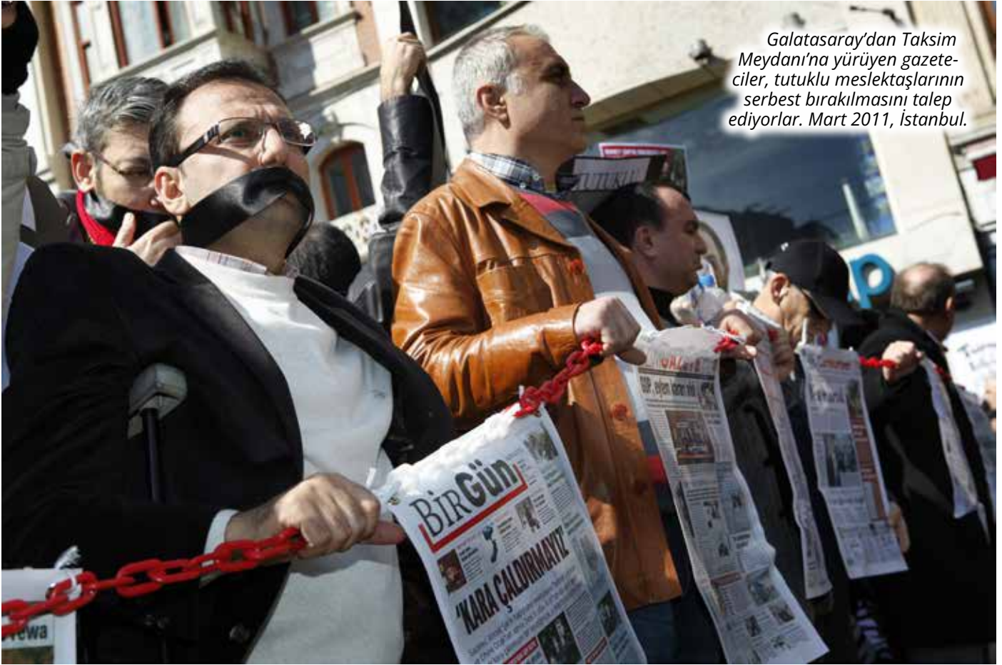
Galatasaray'dan Taksim Meydanı'na yürüyen gazeteciler, tutuklu meslektaşlarının serbest bırakılmasını talep ediyorlar. Mart 2011, İstanbul.