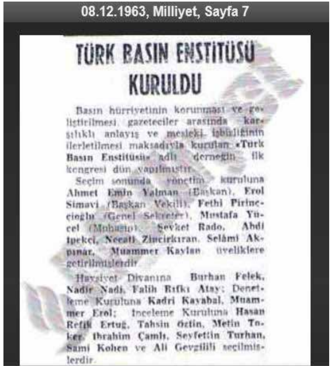
IPI Türkiye, 1963'te "Türk Basın Enstitüsü" adıyla dernekleşti ve sonrasında Türkiye Basın Enstitüsü adıyla özel bir statüye kavuştu.

Bugün, Abdi İpekçi gibi simge bir isimden sonra