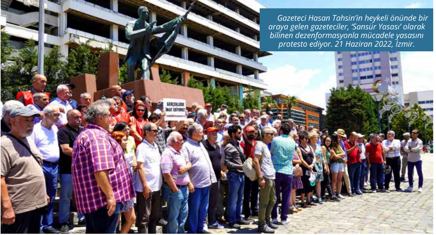
Gazeteci Hasan Tahsin'in heykeli önünde bir araya gelen gazeteciler, 'Sansür Yasası' olarak bilinen dezenformasyonla mücadele yasasını protesto ediyor. 21 Haziran 2022, İzmir.