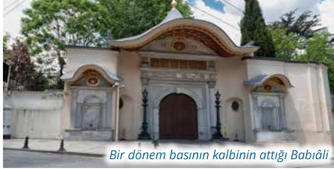
Bir dönem basının kalbinin attığı Babıâli