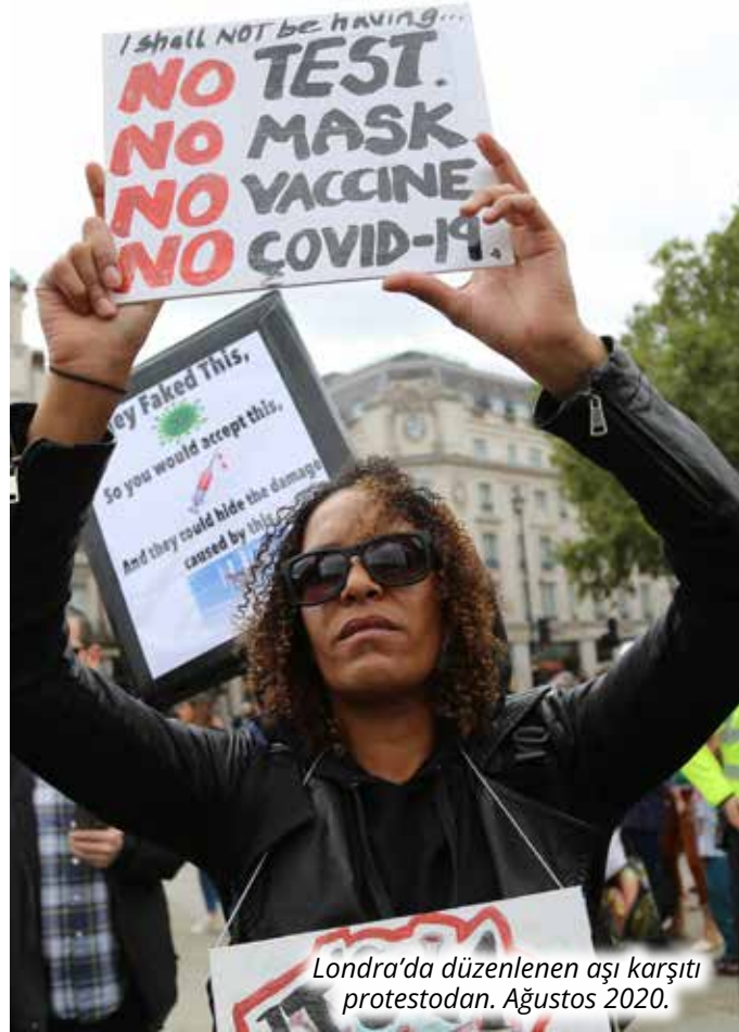
Londra'da düzenlenen aşı karşıtı protestodan. Ağustos 2020.

mu belirsiz, ancak kötü niyet unsuru taşınmasından dolayı bir güvenlik tehdidi olarak görülüyor. 2016 seçimlerinde Hillary Clinton'ın çalınan e-postaları ya da 2022 yılında Yunanistan'da yaşanan dinleme skandalı, bu kategoriye dahil edilebilir. Uluslararası kurumlar da bu tür eylemleri demok-