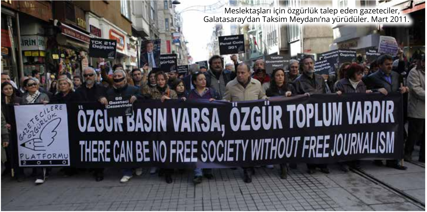
Meslektaşları için özgürlük talep eden gazeteciler, Galatasaray'dan Taksim Meydanı'na yürüdüler. Mart 2011.