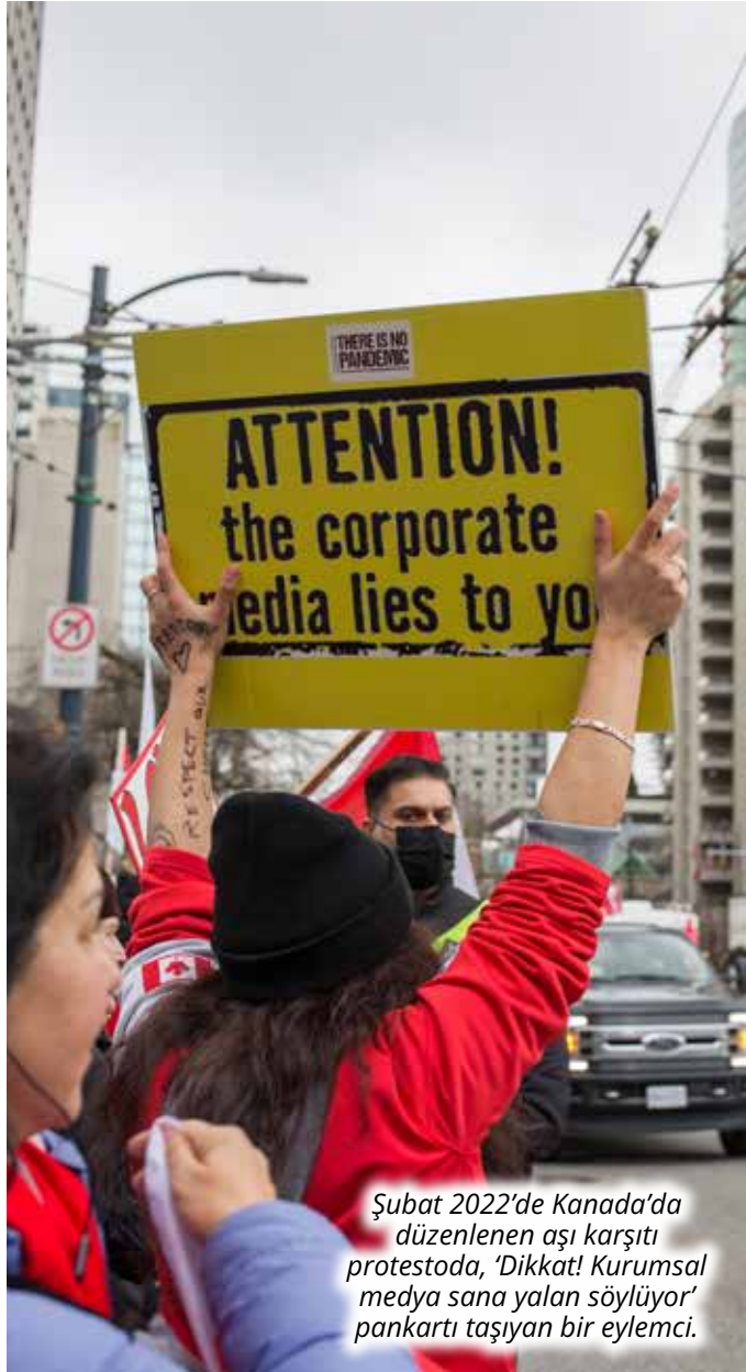
Şubat 2022'de Kanada'da düzenlenen aşı karşıtı protestoda, 'Dikkat! Kurumsal medya sana yalan söylüyor' pankartı taşıyan bir eylemci.

Bilgiye erişimi kolaylaştırarak demokratikleşme sözü veren sosyal medya, vatandaşların bilgiye serbestçe ve kolaylıkla erişmesini sağlamakla kalmayıp aynı zamanda bloglar ve sosyal medya aracılığıyla görüşlerini yayınlamasına olanak tanıyarak onlara seslerini duyurabilecekleri bir imkan verdiği için, Jürgen Habermas'ın (80) tanımladığı anlamıyla kamusal alanın da dijital bir biçimi olarak düşünülmüyordu. (81) Ancak, her ne kadar 2013 yılındaki Gezi eylemleri gibi önemli olaylarda sosyal medya etkin bir şekilde kullanılabilirdi de, hükümetin denetim ve sansür mekanizmaları bu vaat hakkında şüphelere yol açmaktadır.