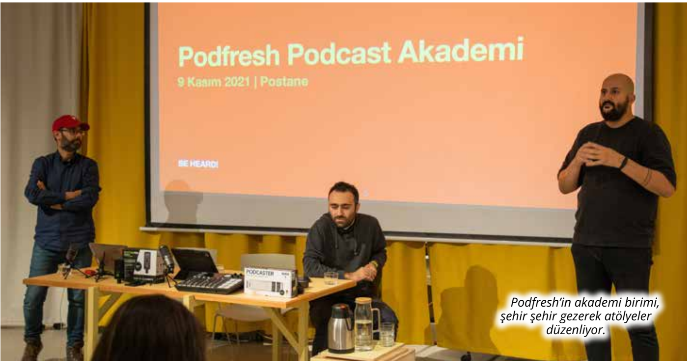
Podfresh'in akademi birimi, şehir şehir gezerek atölyeler düzenliyor.

'Bütün bunlar, büyük oranda, yola hangi amaçla çıktığınızı bilmekle alakalı. Siz nasıl bir dünya hayal ediyorsunuz? Bu dünyaya ulaşmak için neleri yapmak istiyorsunuz? Hangi hedef kitleyle ve hangi yöntemlerle yapacaksınız? Karşınıza koyduğunuz sorunlar neler? Rüzgara kapılmadan hedefe doğru gitmek ve neyi değiştirmek istediğimizi kendimize hep hatırlatmak gerekiyor.'