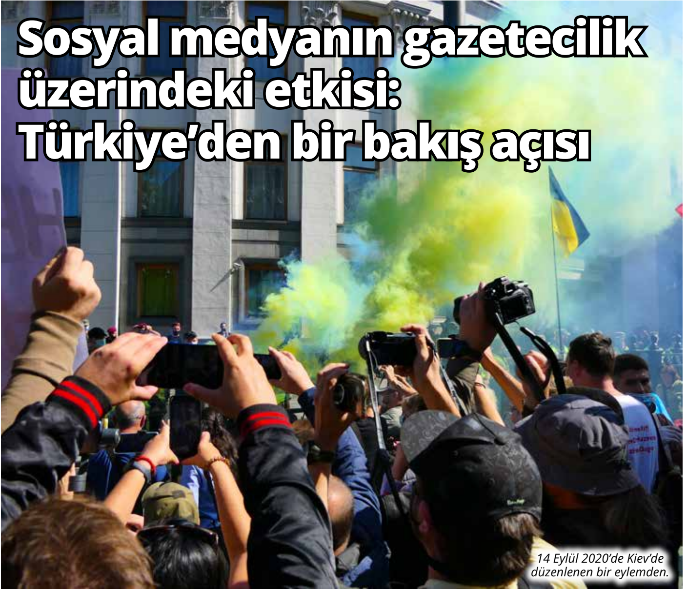
14 Eylül 2020'de Kiev'de düzenlenen bir eylemden.