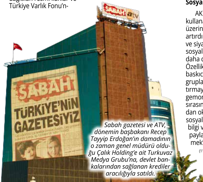
Sabah gazetesi ve ATV, dönemin başbakanı Recep Tayyip Erdoğan'ın damadının o zaman genel müdürü olduğu Çalık Holding'e ait Turkuvaz Medya Grubu'na, devlet bankalarından sağlanan krediler aracılığıyla satıldı.

2013'te yaşanan gelişmelere ilişkin bilgiler Youtube ve Twitter gibi platformlar