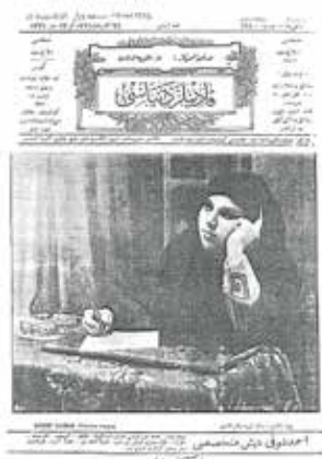
1913 ve 1921 yılları arasında yayınlanan Kadınlar Dünyası dergisinin kapağı.