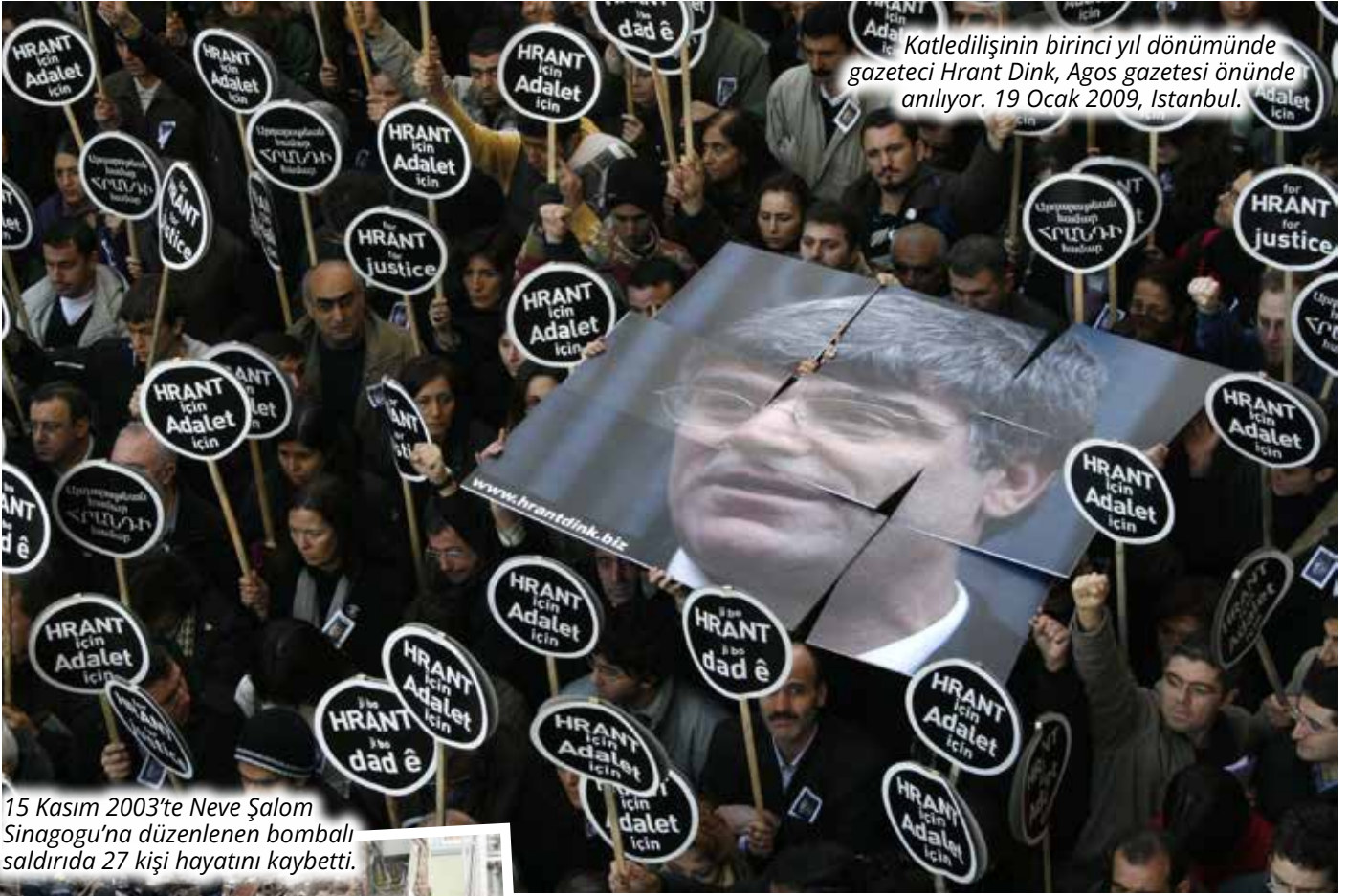
15 Kasım 2003'te Neve Şalom Sinagogu'na düzenlenen bombalı saldırıda 27 kişi hayatını kaybetti.