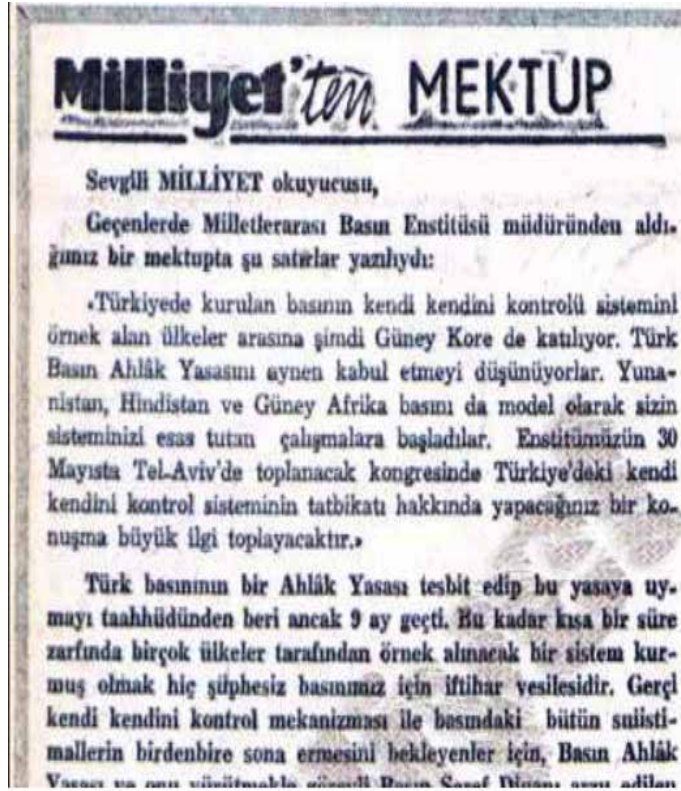
IPI, Türkiye'deki faaliyetlerini sık sık dünyadaki ulusal komitelere de örnek gösterdi.

IPI'nin Türkiye'deki bu çalışması öylesine başarılı olmuştu ki sonraki yıllarda Kanada, Danimarka, Yunanistan, Kenya ve Güney Afrika gibi birçok ülkedeki gazeteciler de özdenetim kurumları oluştururken aynı yolu esas aldı. Bu arada TGC, IPI'nin hazırladığı 9 maddelik metni, 14 Şubat 1972'de yapılan Genel Kurulu'nda "Gazetecilerin Basın Ahlak Kuralları" adıyla kabul etti. Bugün Türkiye'de gazetecilik ilkelerinin temel metni