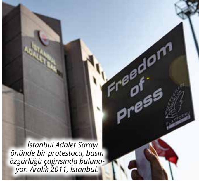
İstanbul Adalet Sarayı önünde bir protestocu, basın özgürlüğü çağrısında bulunuyor. Aralık 2011, İstanbul.

Türkiye'nin Twitter'da 2018'den beri içerik kaldırma taleplerinin %97'sinin geldiği beş ülke arasında 4. sırada yer alması (14), AKP'nin çevrimiçi içeriğe yönelik kontrol isteğinin ne kadar yüksek olduğunun önemli bir göstergesidir. Twitter, 2019 yılının ortasından 2021 sonuna kadar Türkiye'den gelen kaldırma taleplerinin yarıya yakınına yerine getirmiştir. (15) Bu veri, sosyal medya platformlarının da ifade özgürlüğünün sınırlanmasın-